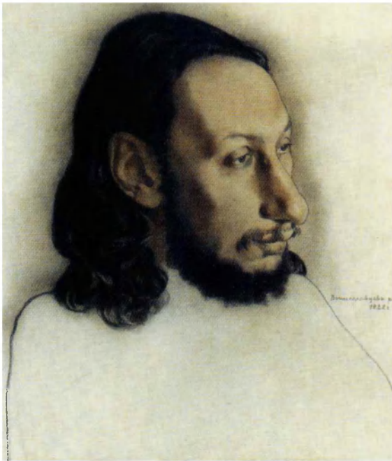
Николай Вышеславцев. Портрет Павла Флоренского 1922. Бумага, цв. карандаши. ГЛМ. Москва