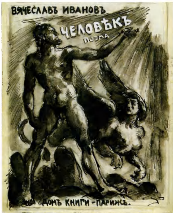
Сергей Иванов. Проект обложки поэмы «Человек» Ок. 1938. Бумага, наклеенная на картон. РАИ