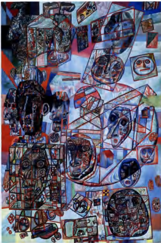
Павел Филонов. Головы («Человек в мире»). Фрагмент 1925–1926. ГРМ. Санкт-Петербург