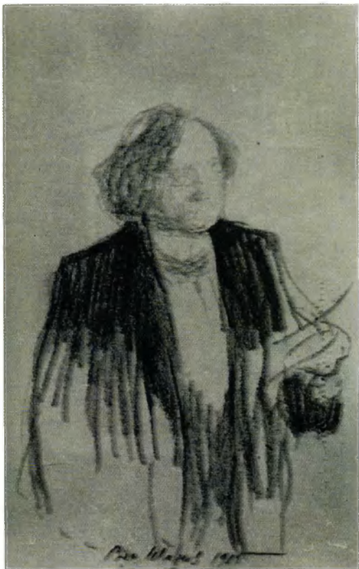
Л.О.Пастернак. Портрет Вячеслава Иванова Альбомная зарисовка. 1915