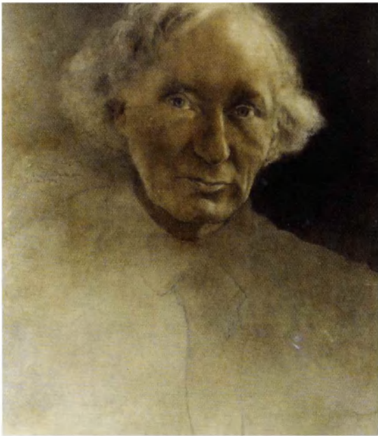
Николай Вышеславцев. Портрет Вячеслава Иванова 1924. Бумага, цветные карандаши. ГЛМ. Москва