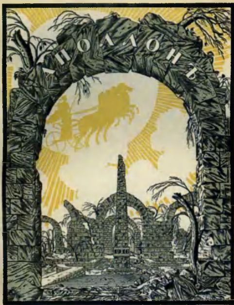
Георгий Нарбут. «Восенний» фронтиспис журнала «Аполлон» (1916), в котором Вячеслав Иванов предполагал издать поэму «Человек»