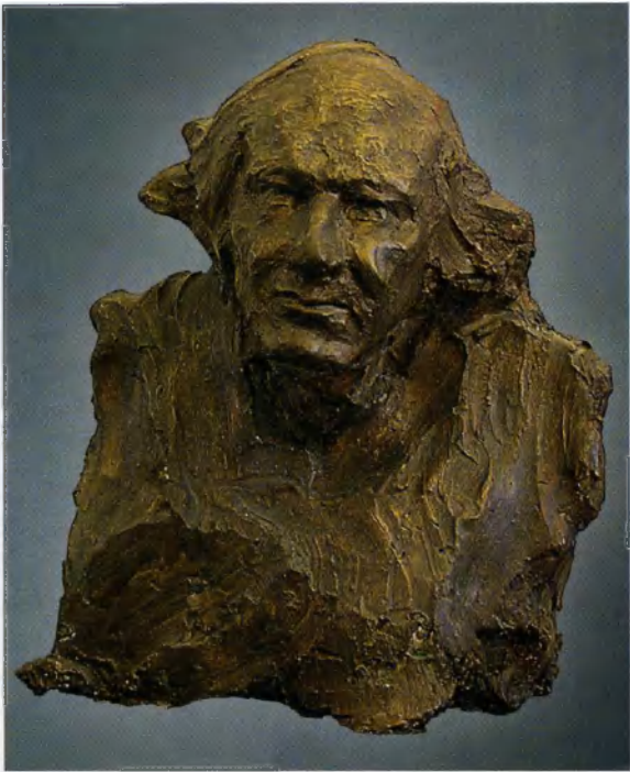
Анна Голубкина. Скульптурный портрет Вячеслава Иванова 1914. Музей А.С.Голубкиной. Москва