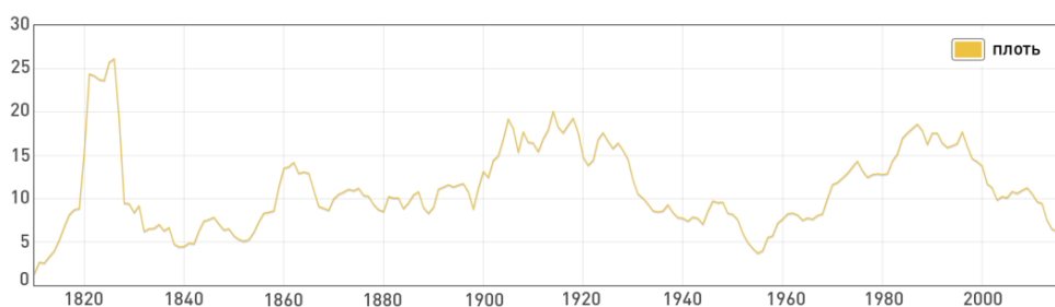
Рис. 1. Частота лексемы «плоть», по данным НКРЯ (1810-2017 гг.). Частота на миллион словоформ. Сглаживание 3 года. Падеж не учитывается.

Приведенный материал показывает, что в настоящее время нет оснований для утверждения о том, что в русской языковой картине мира существует самостоятельный концепт *[ПЛОТЬ], а следует говорить о слове плоть как одном из вариантов обозначения концепта [ТЕЛО] (с точки зрения истории языка церковнославянизм плоть является синонимом русизма тело ).