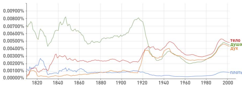
Рис. 4. Частота лексем «плоть», «тело», «душа», «дух», по данным GBNV по русскому корпусу (1810-2008 гг.). Сглаживание 3 года. Падеж не учитывается.