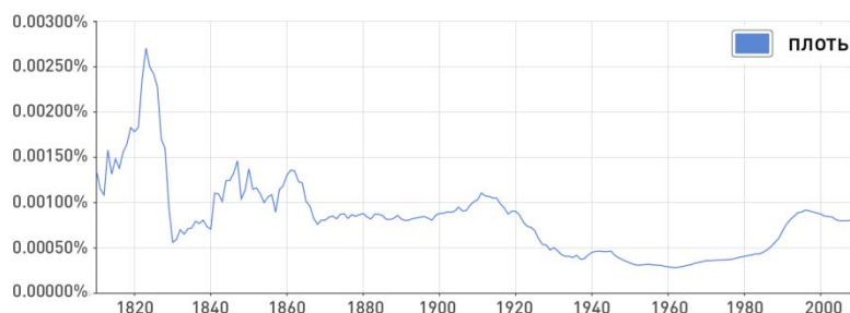
Рис. 2. Частота лексемы «плоть», по данным GBNV по русскому корпусу (1810-2008 гг.). Сглаживание 3 года. Падеж не учитывается.