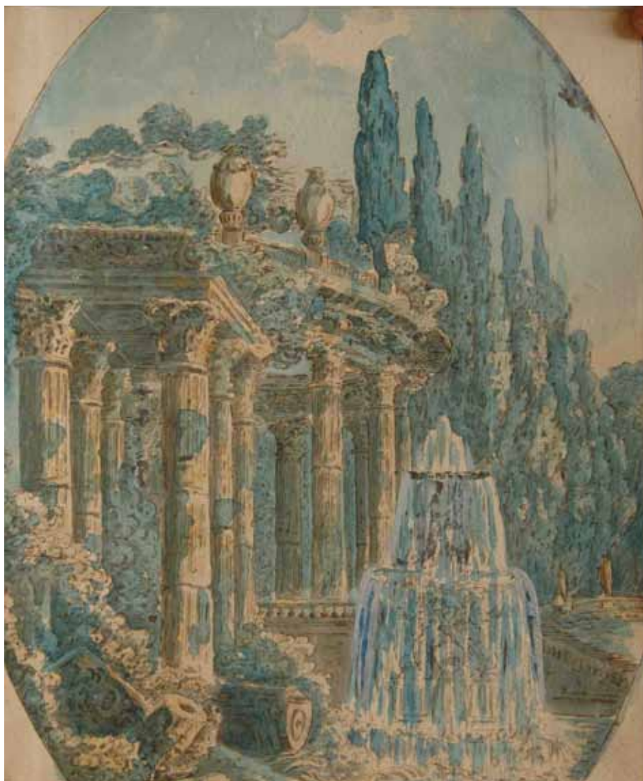
А.Н. Майков. Итальянский вид с фонтаном и коринфским портиком в парке. Бумага, акварель