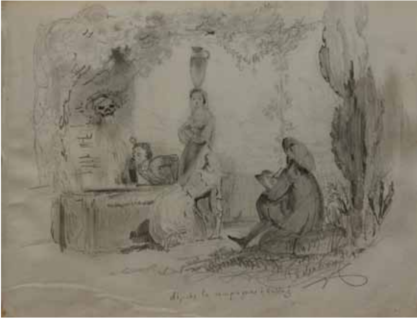
А. Н. Майков. «Ах, как хорошо в деревне!» Бумага, карандаш. Внизу справа подпись: «А. Майков». Внизу посередине карандашом: «Ah, che la campagna è bella!»