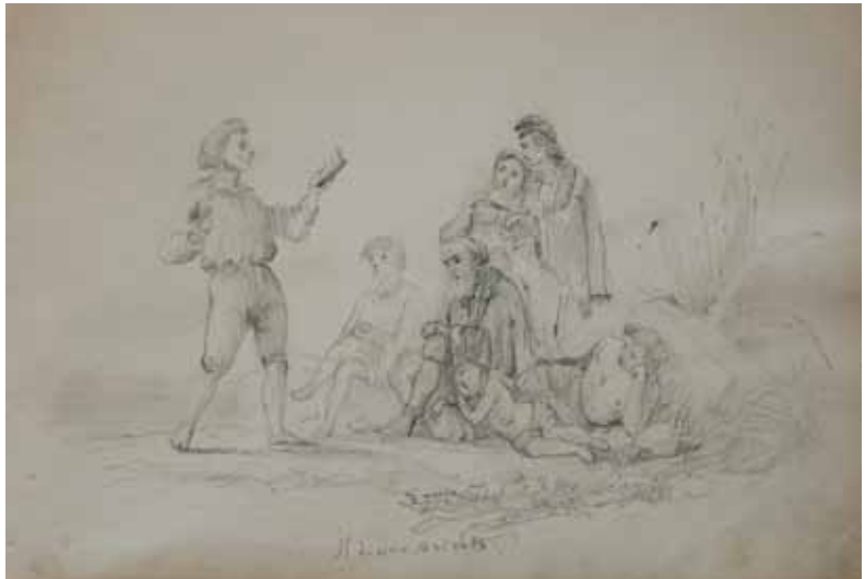
А. Н. Майков. «Божественный Ариосто». Рисунок из альбома видов и типов Италии. Бумага, карандаш. Внизу посередине карандашом: «Il divino Ariosto»