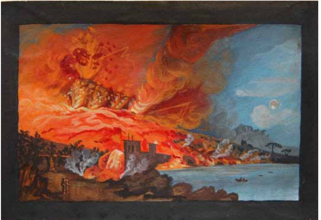
А. П. Елагина. Извержение Везувия. 030 Под изображением белилами: « Eruzione del 1794 »